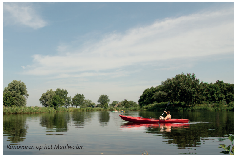
Kánovaren op het Maalwater.