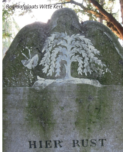
Begraafplaats Witte Kerk